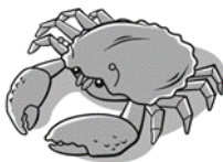
crab – krab ( kreb )

Wykonaj zdania z zeszytu ćwiczeń na stronie 64.