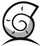
snail – ślimak ( snejl )