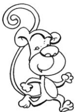
MONKEY ( MANKI )