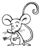
MOUSE ( MAŁS )

Wykonaj zad 1 i 2 str 50 ( zeszyt ćwiczeń )