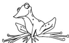
FROG ( FROG )