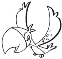
PARROT ( PAROT )

Wydrukuj lub narysuj podane obrazki. Podpisz nazwy zwierząt. Pokoloruj zwierzęta.