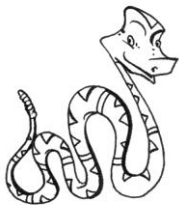
SNAKE ( SNEJK )