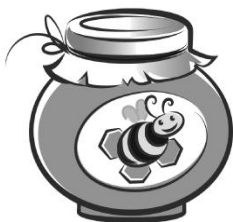
SWEET ( slit ) słodki