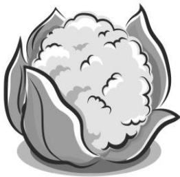
RAW ( rol ) surowy

Wydrukuj lub narysuj podane obrazki. Podpisz nazwy smaków. Pokoloruj ilustracje.